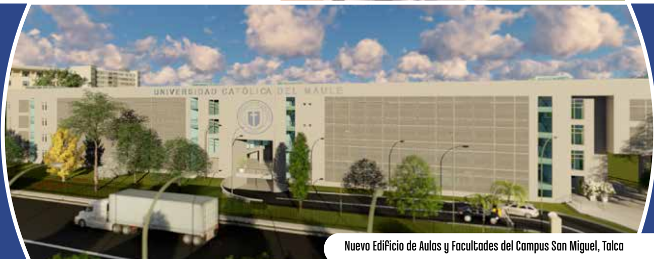
Nuevo Edificio de Aulas y Facultades del Campus San Miguel, Talca