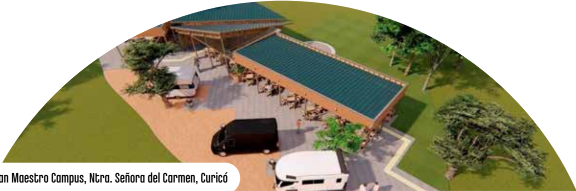
Plan Maestro Campus, Ntra. Señora del Carmen, Curicó