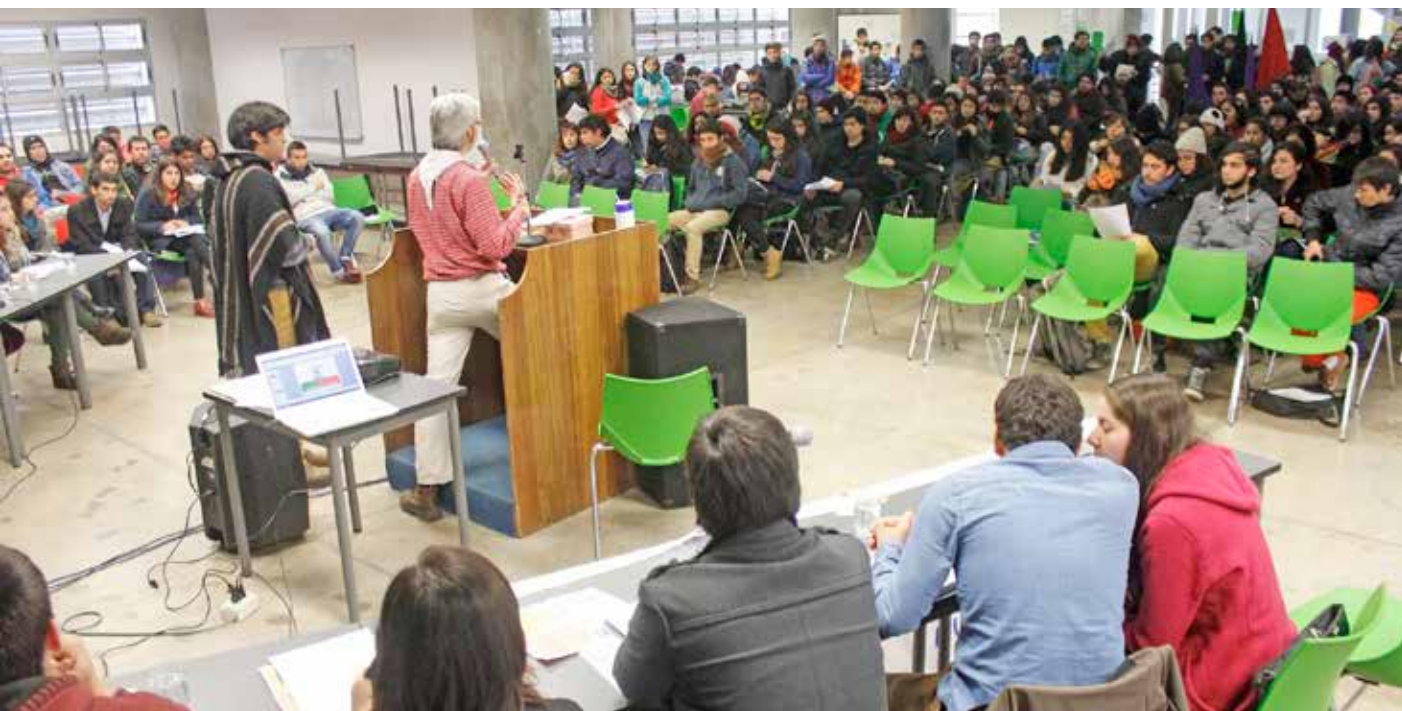
Debate de estudiantes UCM.