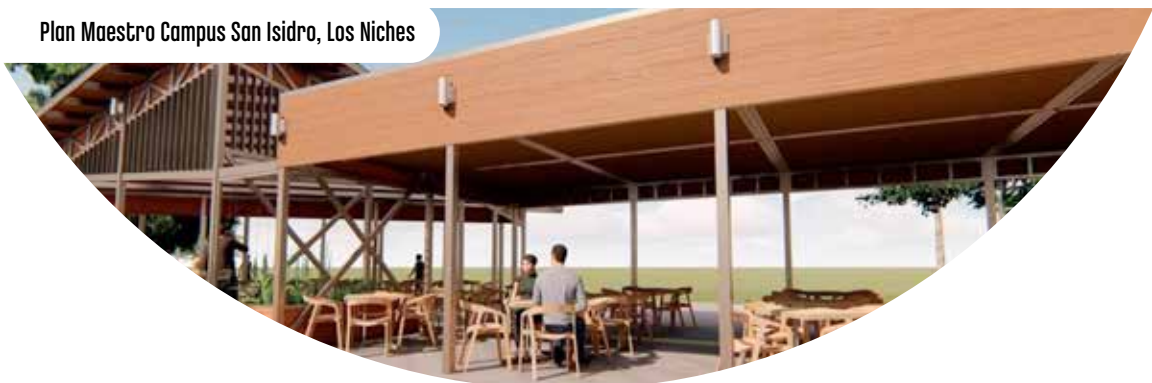
Plan Maestro Campus San Isidro, Los Niches

UCM crece al servicio de la región y el país