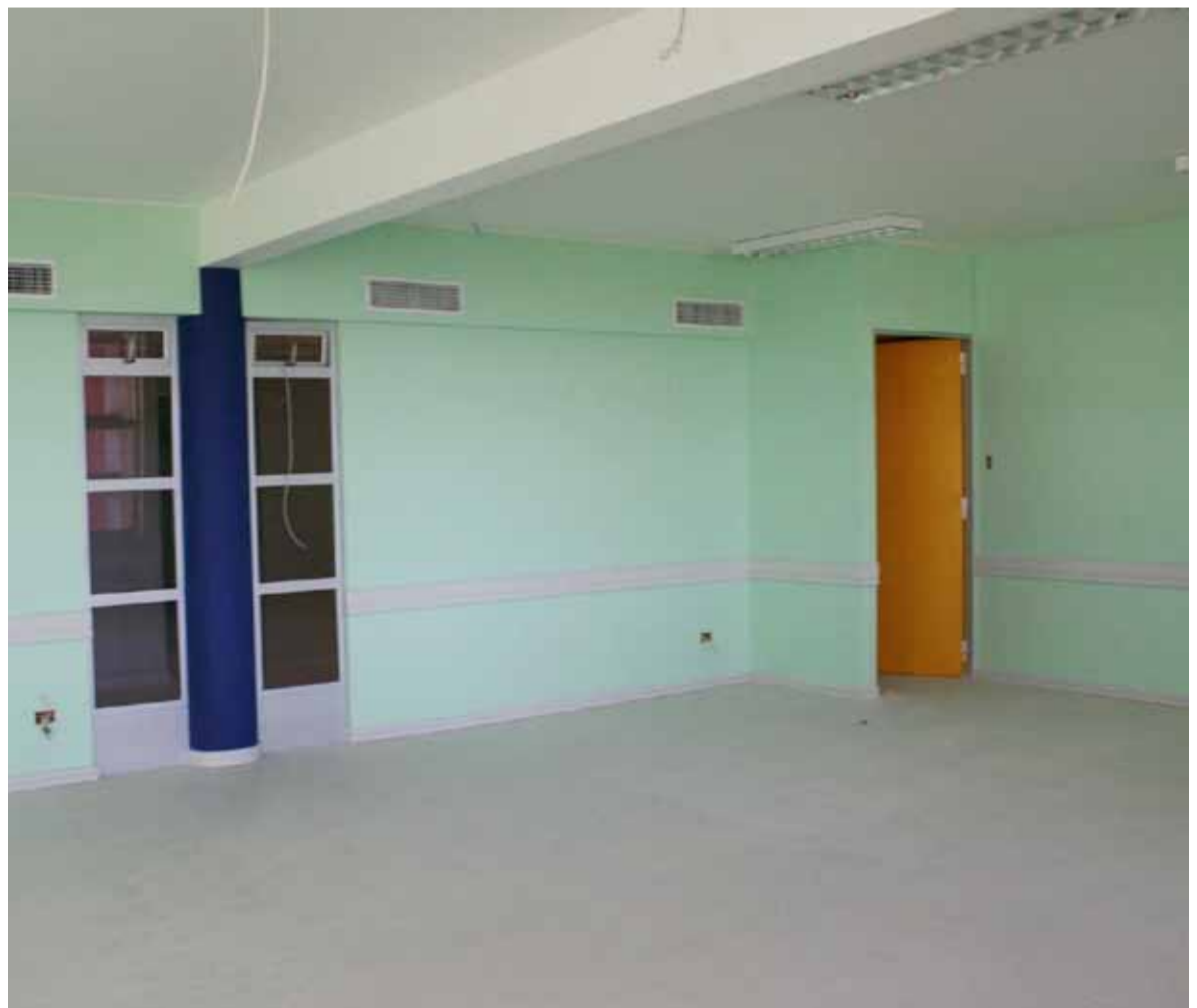
Junto al nuevo edificio en Curicó, la empresa BYC Arquitectos levanta en el campus san miguel el edificio de aprendizaje Autónomo.