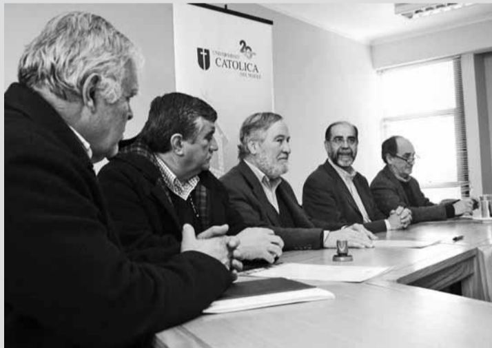
El convenio entre nuestra Universidad y la Universidad de Valladolid, viene a potenciar la colaboración que se estaba generando en áreas como educación.

Conforme a lo acordado, en los próximos meses se creará un organismo coordinador de actividades docentes, la programación de proyectos de investigación e innovación en área de interés común, la realización conjunta de publicaciones, además de la organización de coloquios internacionales, que se sumará al intercambio de investigadores, personal docente, personal administrativo y estudiantes según las necesidades de ambos planteles.