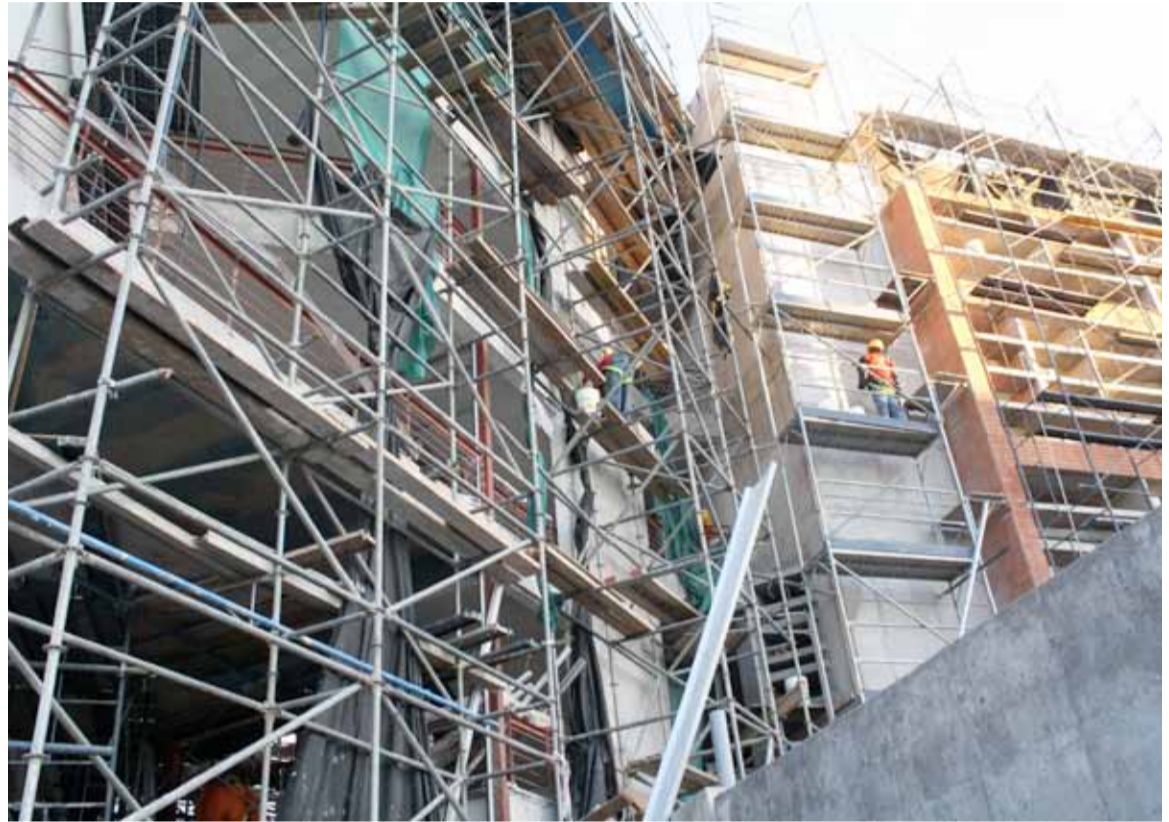
Según el proyecto las obras serán recepcionadas en noviembre.

Según el directivo, se ha dado cumplimiento al pie de la letra a lo comprometido, es decir, se ha cambiado todo el piso en el pasillo central de San Isidro, se ha instalado un nuevo laboratorio de computación, una sala modular para el Centro de Alumnos y Enfermería, así como trabajos en el segundo piso del Auditorium Padre Jaime Verdugo, que permitirá a los estudiantes tener dos nuevas salas de estudio.