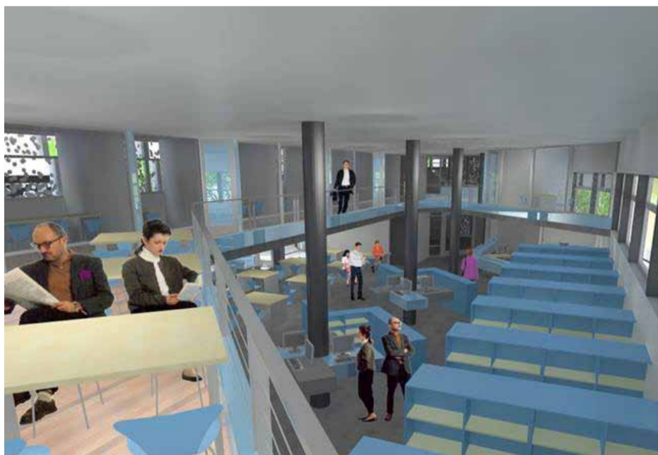
Cinco niveles distribuyen los 3.600 metros 2 construidos.

En el número 255 de la calle Prat funcionará en Curicó el nuevo edificio que nuestra Universidad construye en el centro de la ciudad, obra ubicada frente al acceso del Centro de Extensión del Campus Nuestra Señora del Carmen, que con sus cinco niveles, además del subterráneo para estacionamientos, pondrá a disposición de los estudiantes y de la comunidad universitaria en general, un total de 3.600 metros 2 construidos.