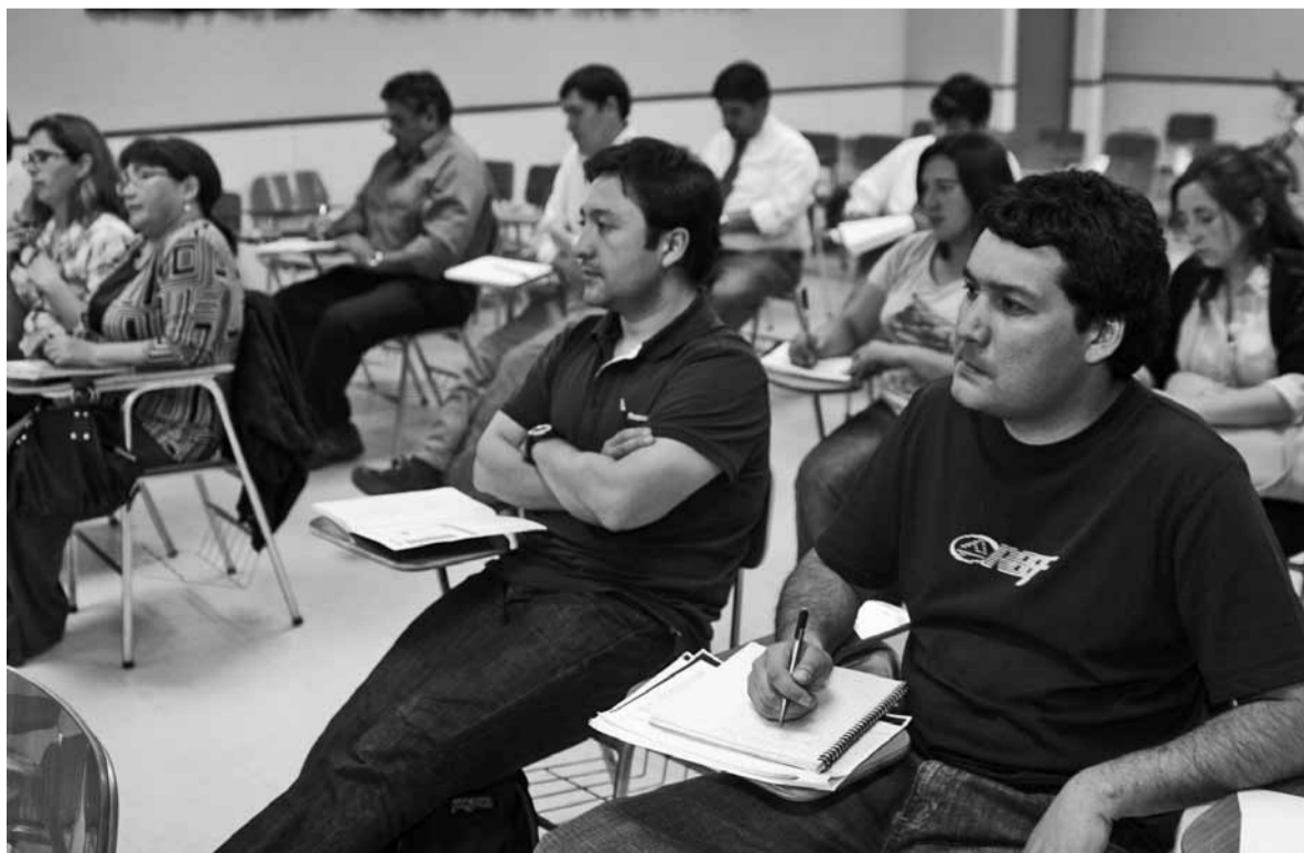
El programa de Magíster en Didáctica de la Matemática tiene como objetivo ingresar al proceso de acreditación en marzo de 2012.

Este programa académico termina con una investigación, por lo tanto hay un énfasis científico marcado, sus contenidos son permanentemente actualizados con las asignaturas, hay abundante material de investigación de punta para el Laboratorio de Rendimiento Humano, por ejemplo, así como acervo científico acumulado por años de trabajo por la Escuela de Educación Física, planta académica de donde colaboran los tutores de tesis, el comité curricular y los directores de escuela y departamento.