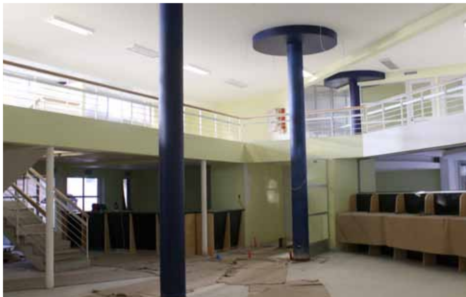
Primer y segundo nivel alberga biblioteca, hemeroteca y videoteca.