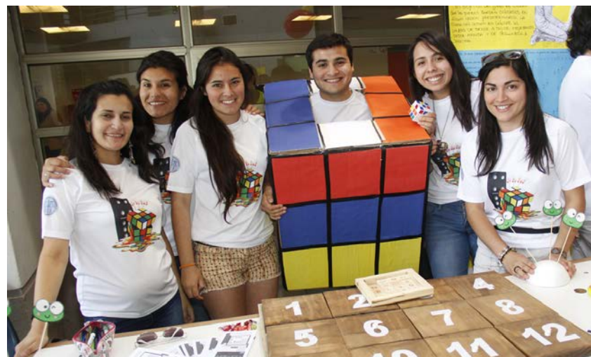
"Feria de las matemáticas: Expo Estructuras Algebraicas Aplicadas", de la Facultad de Ciencias Básicas, noviembre de 2014.