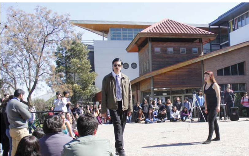
Muestra artística de los estudiantes de la Facultad de Ciencias Sociales y Económicas que conmemoró el 11 de septiembre.