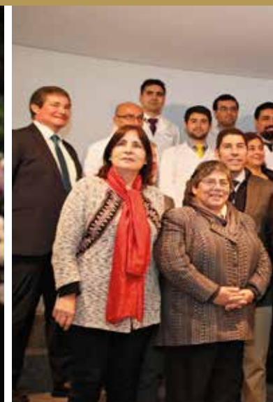
Graduación Becas Maule.