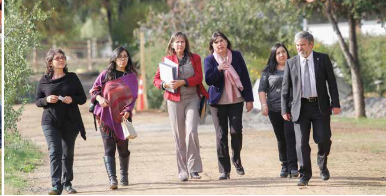
Inauguración Centro de Apoyo al Aprendizaje (CAP).