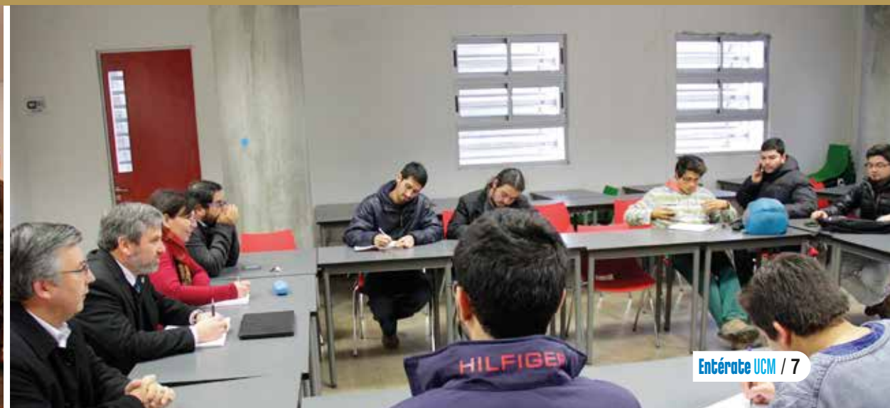
Mesa de trabajo, Plenario de presidentes.