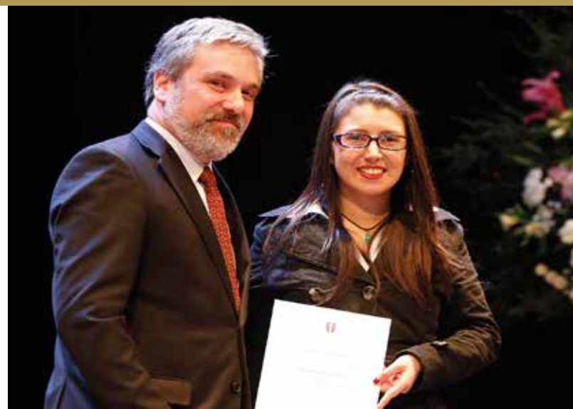
Graduación Universidad del Mar.

Obviamente que para avanzar en esa línea es necesario que la infraestructura esté a la par del crecimiento, por lo que se necesita de un sacrificio de todos y agradezco a la comunidad que ha comprendido que debemos hacer un camino. Siempre considerando que tenemos el compromiso de tener las condiciones necesarias para poder realizar todas las actividades académicas y científicas que tenemos por delante.