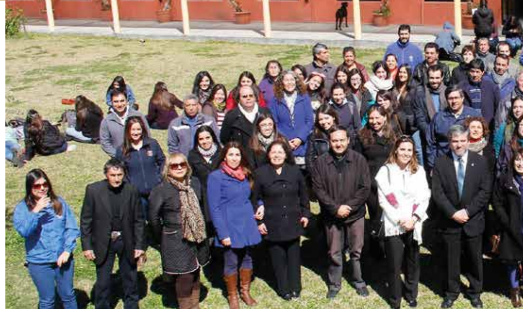
Acreditación Institucional 5 Años (junio 2015 - junio 2020).